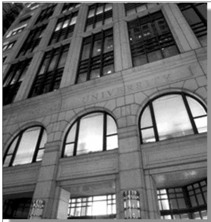
DePaul University w Chicago

U niwersytet DePaul jest największym katolickim uniwersytetem w Stanach Zjednoczonych i największym prywatnym uniwersytetem w Chicago. Właśnie w stuletnią rocznicę założenia w roku 1998 Uniwersytet DePaul przewyższył Uniwersytet St. John w Nowym Jorku liczbą zarejestrowanych studentów i stał się największym katolickim uniwersytetem w U.S.A. W roku 2000, DePaul został dziewiątym, co do wielkości prywatnym uniwersytetem w kraju dołączając do grona szkół takich jak: Harvard, Columbia i University of Southern California.