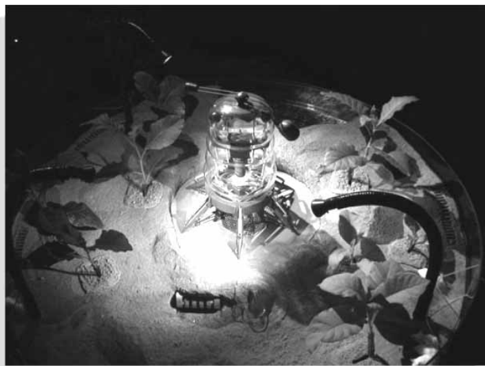
Eight Day - Eduardo Kac

W tym semestrze odbywa się seminarium, którego tytułem jest "Sztuka, technologia i uduchowanie". Proponuje ono spojrzenie na współczesną sztukę multimedialną i interaktywną jako na sztukę, której odbiorca nie może pozostać tylko biernym obserwatorem, ale jest zachęcony do pełnego uczestnictwa w ukończeniu dzieła. Jednak opis i komentarz dotyczący tego rodzaju sztuki, który sięga wyżyn technolog-