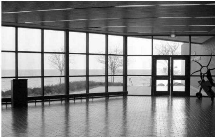
Sala w której przemawiał Alasdair MacIntyre

Center świeciła pustkami. Na początku symposium na widowni zasiadło ok. 60 osób, po przerwie pozostało niewiele ponad 40. Większość zgromadzonego audytorium stanowili studenci z klas, w których zarządzono obowiązkowe uczestnictwo w tym przedsięwzięciu. Całe spotkanie było bardzo dobrze przygotowane, biuletyny informacyjne rozpowszechniono z dużym wyprzedzeniem czasowym, powiadomione były również inne uczel-