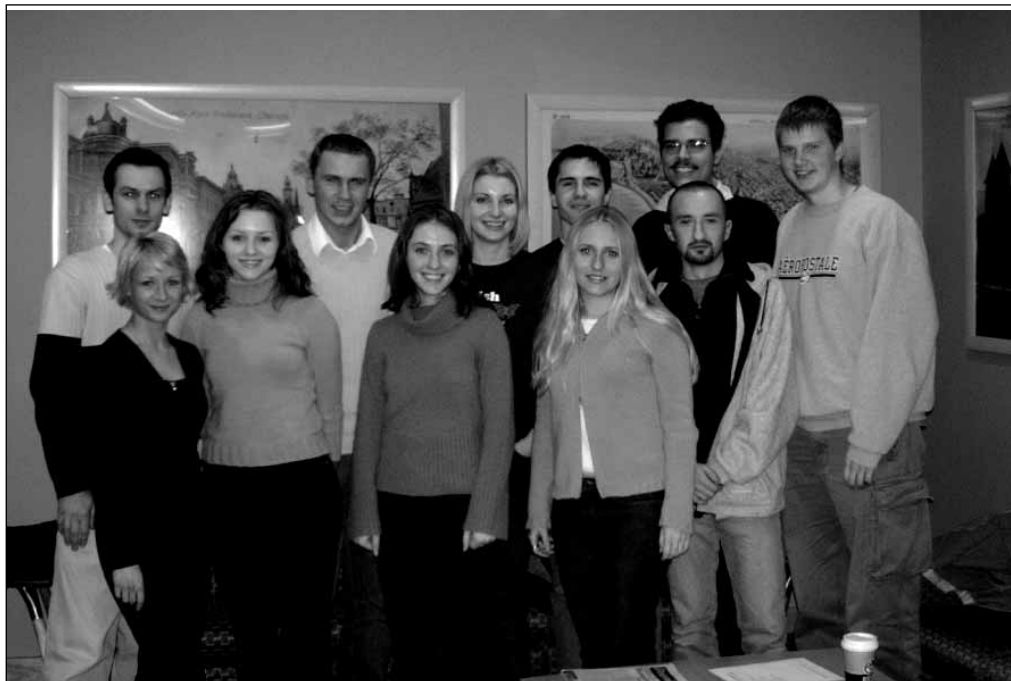
Redakcja Dziennika Akademickiego