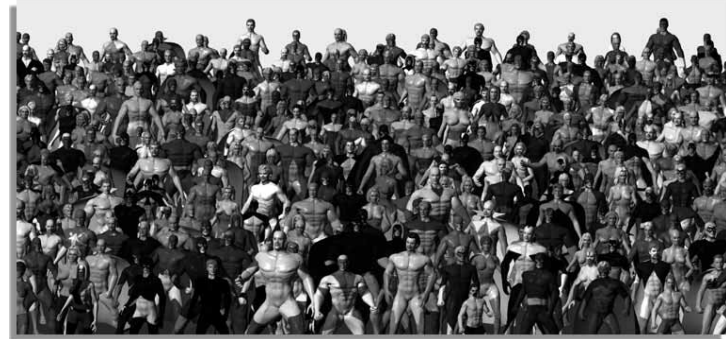
Hero Town - Salavon

W ciągu roku szkolnego młodzi ludzie mają możliwość uczestniczenia w pracach artystycznych, które zapewniają zdobycie doświadczenia i poznania metod pracy współczesnych artystów. W zeszłym roku grupa studentów stworzyła wspólnie Portal, czyli interaktywną i multimedialną instalację składającą się z monitorów komputerowych. Obraz wyświet-