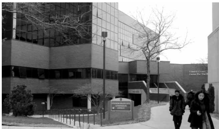
Budunek Crown Center na Uniwersytecie Loyola, w którym przemawiał Alasdair MacIntyre

W amerykańskim systemie szkolnictwa prywatnego szkoły jezuickie zawsze cieszyły się ogromną renomą. Loyola University w Chicago jest jedną z 28 jezuickich uczelni w tym kraju. Warto się zastanowić, co należy do jezuickiego dziedzictwa w szkolnictwie. Dziedzictwo to opiera się na duchowości św. Ignacego, założyciela zakonu jezuitów. Duchowość ta kładzie nacisk na pielęgnowanie wielkich pragnień i postanowień. Dany człowiek w danym momencie może jednakowoż przeżywać zarówno dobre jak i złe podszepty ducha. Rozeznawanie dobrych i złych pragnień skupiło uwagę Św. Ignacego najbardziej. Rozróżnianie tych pragnień, osobiste nawracanie się, pokonywanie wewnętrznych trudności, przemiana pragnień w pragnienia dobre - to elementy pracy nad sobą. To są elementy duchowego dojrzewania. Takie dojrzewanie może się dokonywać na różnych poziomach. Na poziomie intelektualnym oznacza ono przechodzenie od ignorancji i uprzedzeń do otwartego poznawania świata, do "słuchania" otaczającej rzeczywistości w całym jej realizmie, wolnego od rozmaitych iluzji. Na poziomie moralnym oznacza to przechodzenie od wartości nastawionych na samozadowolenie i samo satysfakcję do wartości zakorzenionych w Bogu i w tych elementach dobra, które do Boga prowadzą. Na poziomie emocjonalnym dojrzewanie będzie się wiązało z kształtowaniem fascynacji. W kontekście szkolnym możemy więc mówić o radości odkrywania, o zachwycie lekturą i pro-