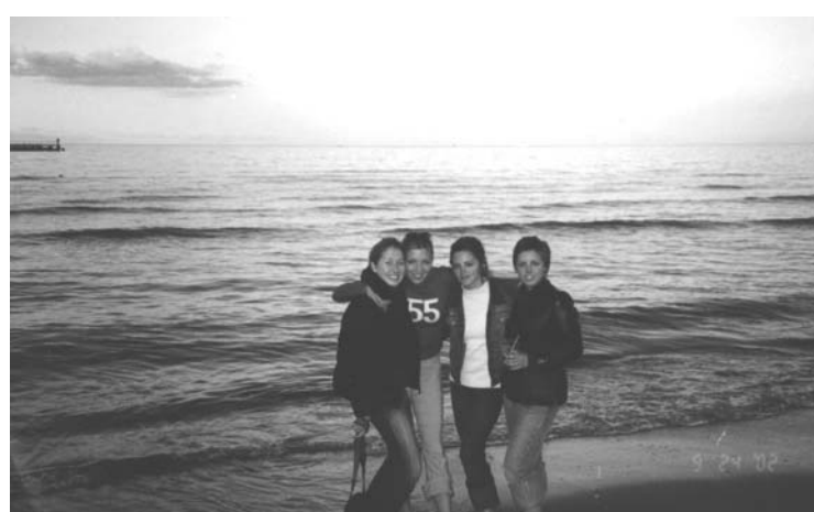
Z koleżankami w Sopocie, mocząc stopy w Bałtyku, oglądając piękny zachód słońca.