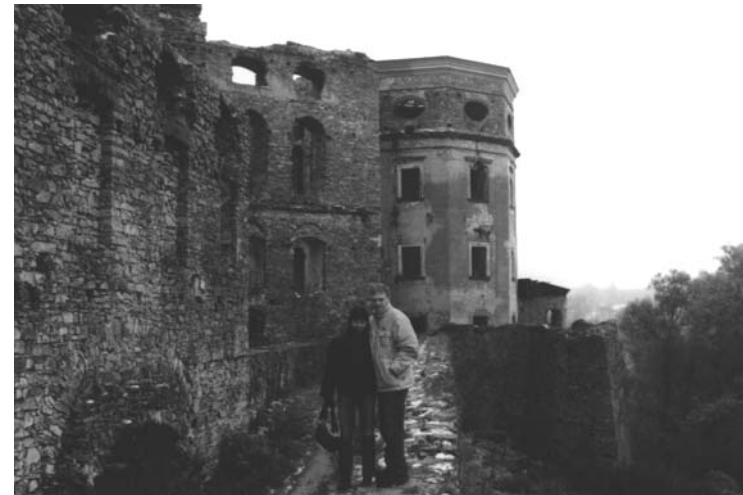
Zamek Krzyżtopór - każdemu bardzo się podobało zwiedzanie ogromnych, starych ruin w Ujeździe.