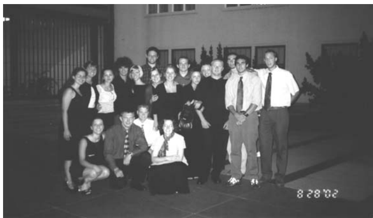
Na ulicach Pragi, cała grupa w trakcie jednego z wielu uroczystych wieczorów.