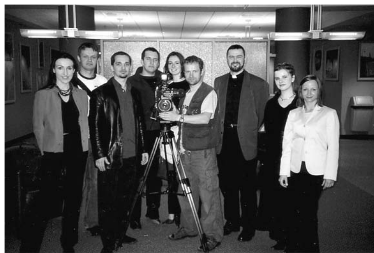
Uczestnicy dyskusji o subkulturze studenckiej na DePaul

Czy istnieje subkultura studencka? To zależy od indywidualnego podejścia każdego studenta. Jeśli na przykład dana osoba nie czuje potrzeby czy bliskości kontaktowania się ze swoimi rówieśnikami, nie odczuwa potrzeby więzi, to dla tej osoby może się wydawać, że nie ma czegoś takiego jak subkultura studencka. On czy ona ma tyle spraw na swojej głowie, że nie ma czasu, aby brać czynny udział w tworzeniu specyficznej podkultury. Co za tym następuje, to że najprawdopodobniej ten student/ka nie zauważa istnienia subkultury. Z drugiej strony, dla wielu studentów jest to ważną część ich życia i przez spotkanie się, organizowanie różnych atrakcji czy nawet krótkich rozmów pomiędzy lekcjami