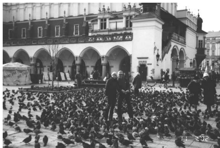
Nawet w trakcie klasy historii sztuki, trzeba było zrobić małą przerwę na zdjęcie oraz nakarmienie gołębi.