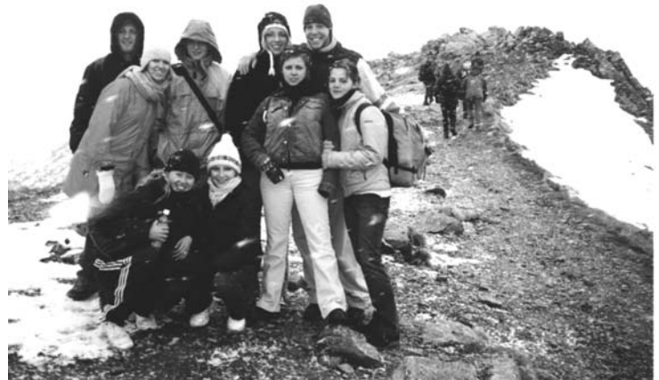
Juz we Wrzesniu cieszyliśmy się pierwszym śniegiem, na szczycie Kasprowego Wierchu w Zakopanym.

czym mieliśmy wycieczkę po Krakowie. Następnego dnia już rozpoczęliśmy klasy. Nasze wykłady były po angielsku, a klasy z języka polskiego po polsku. Wykłady mieliśmy nie na głównej uczelni, lecz nie daleko