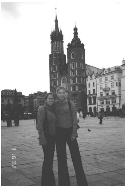
Pierwsze chwile w Krakowie, oczywiście spędzone na pięknym, historycznym rynku.

św. Królowa Jadwiga, Wit Stwosz, hejnał mariacki, Tadeusz Kościuszko, Jan Matejko, Stanisław Wyspiański, Karol Wojtyła, Czesław Miłosz, Wisława Szymborska, Piwnica pod Baranami oraz ostatnio Schindler i jego lista. Wszystkie te hasła znane i bliskie większości Polaków, a także niemałej liczbie cudzoziemców, odnoszące się do ludzi, miejsc, wydarzeń i legend, składają się na tożsamość miasta. Czasami oglądam moje zdjęcia i nie wierzę, że miałam takie super przeżycie, że zrealizowałam moje marzenie studiowania w Polsce, oraz że teraz słowo Kraków znaczy więcej dla mnie niż tylko sławne zabytki.